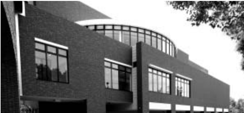
近畿大学高度先端総合医療センター（PET診断部門）

塩崎病院長は「PETの導入で、がんの早期発見が飛躍的にアップし、治療率を高められる。本院の『地域医療連携室』を活用した地域の医療機関との病診、病病連携を密にしなが